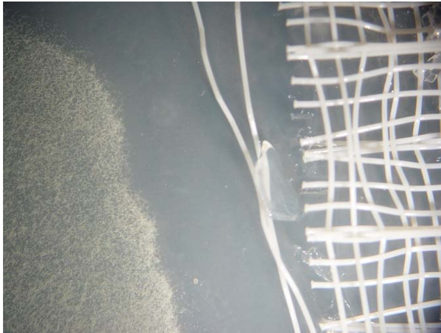
Bild 1, Verfahren A: Prüfkörper nach 4 Wochen Bebrütungszeit, kein Pilzwachstum auf dem Prüfkörper sichtbar, Ausbildung einer Hemmzone um den Prüfkörper herum